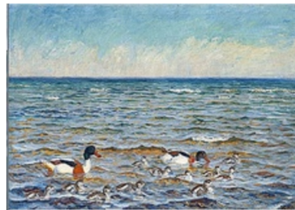
Johannes Larsen: Gravænder med ællinger på fjorden. 1914. Olie på lærred. 95 x 131 cm. Johannes Larsen Museet. Inv. 2-1400. Gave fra Ny Carlsbergfondet 2008