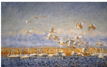
Johannes Larsen: Svanerne letter, Filsø. 1914. Olie på lærred. 221,3 x 134,4 cm. Brandts