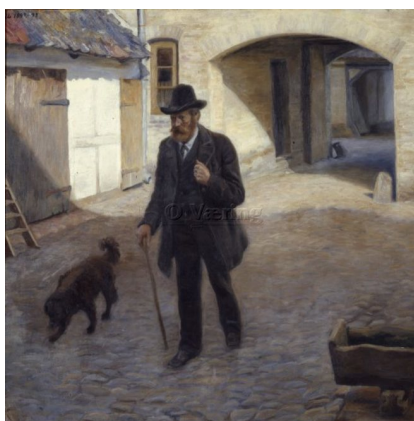
Johannes Larsen: Min Fader og Bob. 1892-93. 94x94. Olie. Faaborg Museum