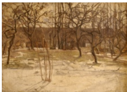
Karl Schou: Smeltende sne. 1907. Olie på lærred. 49 x 68 cm. Faaborg Museum. Inv. nr. 219. Købt 1910