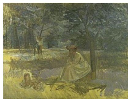
Karl Schou: Have med figurer. 1908. Olie på lærred. 96 x 125 cm. Faaborg Museum. Inv. nr. 221. Købt 1910