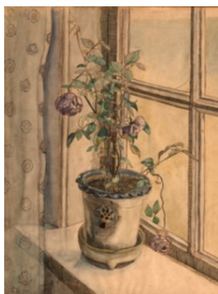
Christine Swane: En rose. 1907. Tusch og akvarel på papir. 640 x 490 mm. Faaborg Museum. Inv. nr. 235. Købt 1910