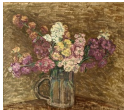
Christine Swane: Levkøjer. 1909. Olie på lærred. 47 x 55 cm. Faaborg Museum. Inv. nr. 236. Købt 1910