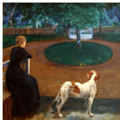
Johannes Larsen: Regnfulde augustdage. 1892-1893. Olie på lærred. 94 x 94 cm. Faaborg Museum. Inv. nr. 112. Købt 1910