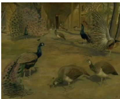
Johannes Larsen: Påfugle. 1903. Olie på lærred. 136,5 x 176,5 cm. Statens Museum for Kunst

Det fremgår af tidligere breve, at det er billedet af påfugle, som Johannes Larsen malede på i Zoo. Nu maler han tilsyneladende også en kvælerslange.