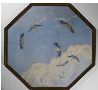
Johannes Larsen: Kredsende storke. 1923-1924. Olie på lærred. 180 x 180 cm. Johannes Larsen Museet

Det indsatte storkebillede er et forstudie til det loftsbillede, som Johannes Larsen lavede til Kongens Håndbibliotek på Christiansborg. Johannes V. Jensen skrev et digt, Skabningens Tinde, til Larsens billede Åen. Jensen ejede en akvarelverson af Åen.