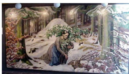
Fritz Syberg: Moderen og tornebusken. 1930-1933. Olie på lærred. H.C. Andersens Hus

Odensebillederne: Fritz Syberg modtog en bestilling på malerier til forhallen i H.C. Andersens Hus i Odense. Han var et par år om at gøre dem færdige. Malerierne hænger ikke længere (i 2020) fremme på dette museum. Birkebillederne: Portrættet af Johs. V. Jensen kan være det ene af disse. Billedet er malet i forfatterens hus i Tibirke.