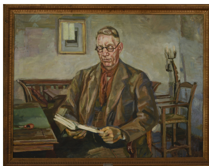
Fritz Syberg: Ved bogen. Portræt af Johannes V. Jensen. 1936. Olie på lærred. 113 x 145. Johannes Larsen Museet