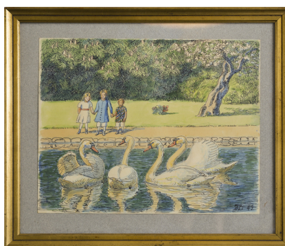
Johannes Larsen: Den Grimme Ælling. Den nye er den smukkeste. 1947. Akvarel og tusch. 22 x 28 cm. Johannes Larsen Museet

Johannes Larsens illustrationer til Hans Hvass: Sjældne fugle. Larsens akvarel til tidsskriftet fremtiden. Larsens akvareller til HC Andersen: Den Grimme Ælling. Johannes Larsen skal male syv oliebilleder til en mand i Århus.