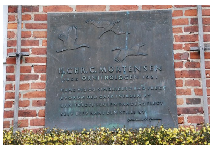
Johannes Larsen og Johannes V. Jensen: Mindetavle over Hans Christian Mortensen. Latinerhaven i Viborg

Johannes Larsen laver vignetter til en bog med Ambrosius Stubs digte.