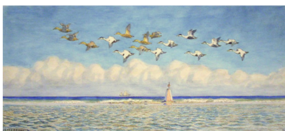
Johannes Larsen: Edderfugle over Hatterrevet. 1949. Akvarel. 33 x 71 cm. Johannes Larsen Museet

Johannes Larsen: Edderfugle over Hatterrevet, akvarel, ejes af Johannes Larsen Museet. En udgave af motivet i olie er ejet af den danske kongefamilie.