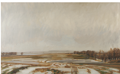
Fritz Syberg: Landskab i Februar. 1924. Olie på lærred. 117 x 187 cm. Privateje

Billedet, der skulle udstilles i Venedig, er formodentlig Udsigt over Kerteminde Fjord også kaldet Landskab i februar, som Jensen-familien ejede. Johannes V. Jensen skrev digtet Landskab i Februar til maleriet. Dette digt blev første gang trykt i Kunstbladet, Kunstforeningen i København, 1. hæfte, 2. årgang, januar 1924, side 28-30 sammen med et foto af maleriet. Siden er digtet blevet genoptrykt i Du danske Sommer - Fynbomalerne og de jyske forfattere i samklang, Johannes Larsen Museet 2007, s. 139. ■ indehallen i Odense: Fritz Syberg havde en bestilling på en række store malerier til forhallen på det nyligt ombyggede H.C. Andersens Hus i Odense. Malerierne hænger ikke længere (2020) fremme på dette museum.