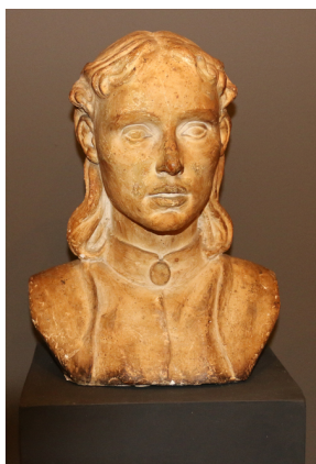
Fritz Syberg: Anna Syberg. Buste. Patineret gips. Johannes Larsen Museet