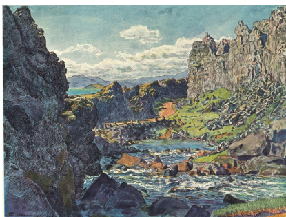
Johannes Larsen: Almannagjá. Udat. Akvarel og tusch. Ejer og mål ukendt. Scan fra Johs. V. Jensens bog