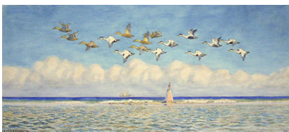
Johannes Larsen: Edderfugle over Hatterrevet. 1949. Akvarel. 33 x 71 cm. Johannes Larsen Museet. Skitse til olieblade til Kongeskibet