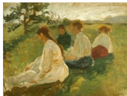
Johannes Larsen: Sommerdag ved brinken. 1896. Olie på pap. 29 x 39 cm. Faaborg Museum