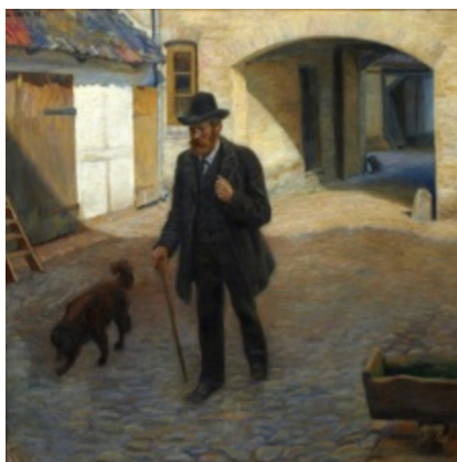
Johannes Larsen: Min fader og Bob. 1892-1893. Olie på lærred. 94 x 94 cm. Faaborg Museum

Faaborg Museum. Inv. nr. 110assets/5/9/66/JL_Min_fader_og_Bob_1892-93_Olie_94_x_94_Faaborg_Mus_inv_110.jpg!