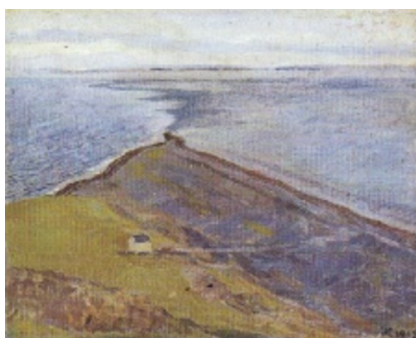
Johannes Larsen: Vesterrevshuset. Solskin. Sprogø. 1913. Olie på lærred. 59 x 74 cm. Johannes Larsen Museet. Købt 1998

Johannes Larsen maler et mindre billede med stille gråvejre og et par svømmende havlitter.