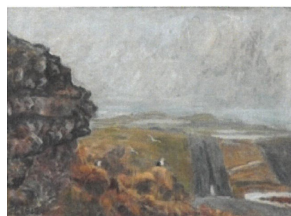
Johannes Larsen: Fra Fyrbakken mod Vest Regn Sprogø 1912 Olie på lærred 47 x 64 cm Til salg fra Bruun Rasmussen 2017