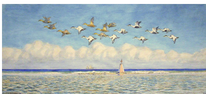
Johannes Larsen: Edderfugle over Hatterrevet. 1949. Akvarel. 33 x 71 cm. Johannes Larsen Museet

Johannes Larsen: Edderfugle over Hatterrevet, akvarel, ejes af Johannes Larsen Museet. En udgave af motivet i olie er ejet af den danske kongefamilie.