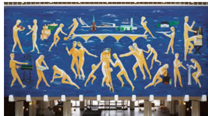
Hagedorn-Olsen: Menneskesamfundet. Vægudsmykning, Århus Rådhus. 145 m 2