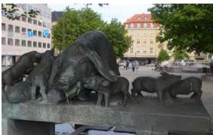
Mogens Bøggild: Grisebrønden. 1941. Bronze. Aarhus Rådhus