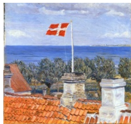
Johannes Larsen: Sommer, solskin og blæst. 1899. Olie på lærred. 44 x 46 cm. Ordrupgaard