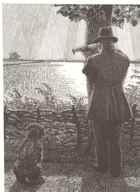
Johannes Larsen: Hygæa krydser ind. 1927. Træsnit. 42 x 38 cm. Johannes Larsen Museet