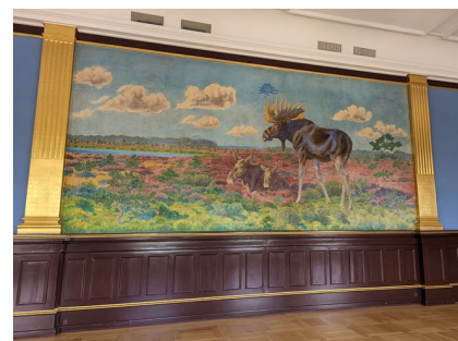
Johannes Larsen: Elsdyr. 1935-1936. Fresko. Odense Rådhus