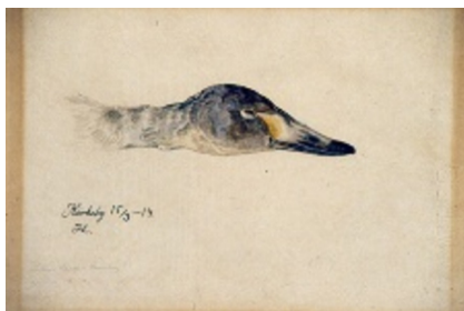
Johannes Larsen: Pibesvanehoved. 15. marts 1914. Tusch og akvarel på papir. 310 x 470 mm. Johannes Larsen Museet. Gave 1997