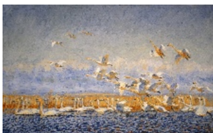
Johannes Larsen: Svanerne letter, Filsø. 1914. Olie på lærred. 221,3 x 134,4 cm. Brandt