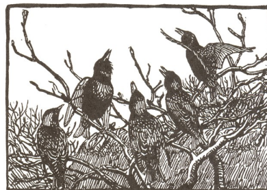
Johannes Larsen: Stære. 1911-1913. Træsnit til St. St. Blichers Trækfuglene. En Naturconcert