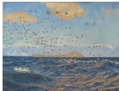
Johannes Larsen: Edderfugle ved Vesterrevet, Sprogø. 1913. Olie på lærred. Statens Museum for Kunst