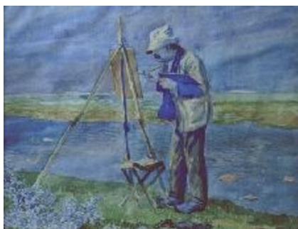
Johannes Larsen: Philipsen maler, Saltholm. 1913. Akvarel. 460 x 600 mm. Faaborg Museum Købt ca. 1913

Johannes Larsen maler akvareller af Th. Philipsen. Nogle af værkerne er gengivet i Philipsen og Fynboerne. Randers Kunstmuseum og Johannes Larsen Museet 2001