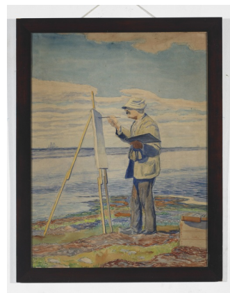
Johannes Larsen: Philipsen maler, Saltholm. 1913. Akvarel. 600 x 450 mm. Johannes Larsen Museet.