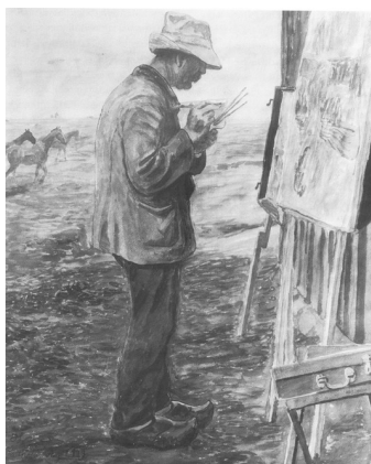
Johannes Larsen: Philipsen maler, Saltholm. 1913. Akvarel. Privateje