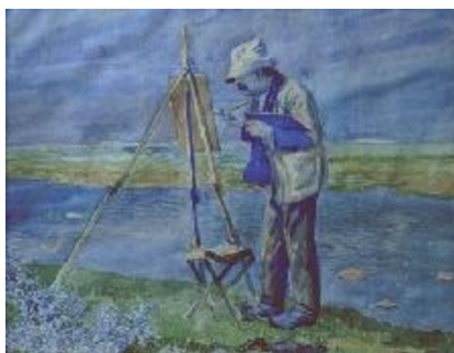
Johannes Larsen: Th. Philipsen maler, Saltholm. 1913. Akvarel. 460 x 600 mm. Faaborg Museum. Købt ca. 1913

Philipsen har foræret Johannes Larsen fire tegninger med samme motiv klæbet sammen på et papir