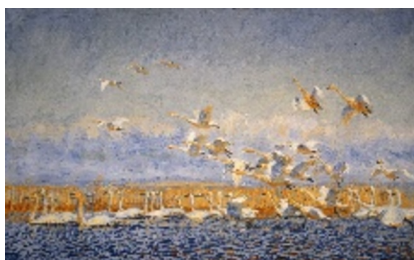
Johannes Larsen: Svanerne letter, Filsø. 1914. Olie på lærred. 221,3 x 134,4 cm. Brandts