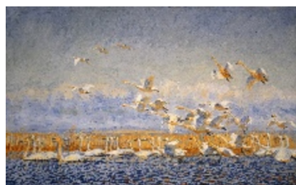
Johannes Larsen: Svanerne letter. Filsø. 1914. Olie på lærred. 221,3 x 134,4 cm. Brandts. Erhvervet 1915