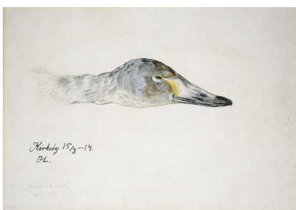
Johannes Larsen: Hoved af Pibesvane. Kirkeby. 1914. Akvarel og tusch. 310 x 480 mm. Johannes Larsen Museet.

Johannes Larsen har malet svaneheder. Man vil til Malmøudstillingen anmelde Stenen ved stranden og billeder af Havlitter og Knortegæs.