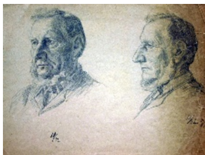
Johannes Larsen: Dobbeltportræt af ældre mand. 1897. Blyant. Brandts