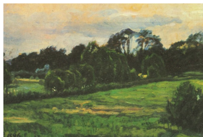
Johannes Larsen: Engen. 1896. Olie på lærred. Privateje