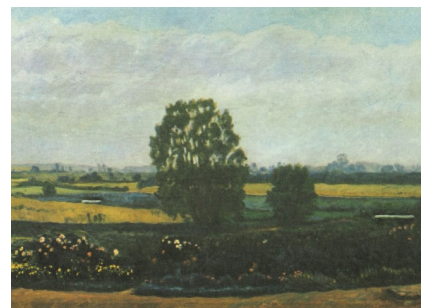
Johannes Larsen: Udsigt mod Lyndelse. Udat. Olie på lærred. 52 x 61 cm. Privateje