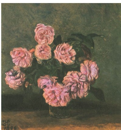
Johannes Larsen: Provenceroser. 1896. 38 x 35,5 cm. Privateje