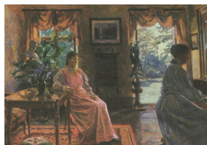
Johannes Larsen: Havestuen. Udat. 40,5 x 55,5 cm. Olie på lærred. Privateje