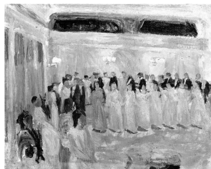
Peter Hansen: Bal i en provinsby. 1894. Olie på lærred. 53 x 66,5 cm. Göteborgs Konstmuseum