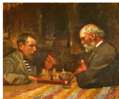
Fritz Syberg: Skakspillere. 1891. Olie på lærred. 67 x 79 cm. Faaborg Museum