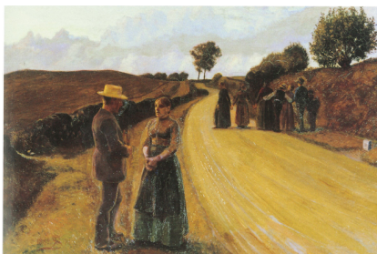
Fritz Syberg: Aften og Erotik. 1888-1891. Olie på lærred. 102 x 152 cm. Nasjonalmuseum Stockholm