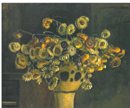
Johannes Larsen: En buket evighedsblomster. 1895. Olie på lærred. 48,5 x 59 cm. Statens Museum for Kunst