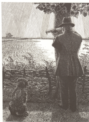
Johannes Larsen: Hygæa krydser ind. 1927. Træsnit. 42 x 38 cm. Johannes Larsen Museet