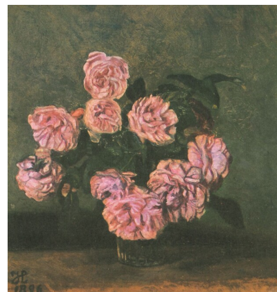
Johannes Larsen: Provenceroser. 1896. 38 X 35,5 cm. Privateje. Scan fra bog