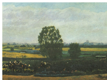
Johannes Larsen: Udsigt mod Lyndelse. Udateret. Olie på lærred. 52 X 61 cm. Privateje. Scan fra bog