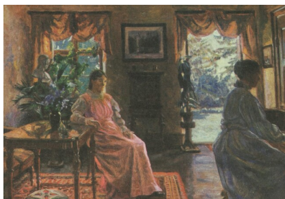
Johannes Larsen: Havestuen. Udateret. 40,5 X 55,5 cm. Olie på Lærred. Privateje. Scan Fra Bog