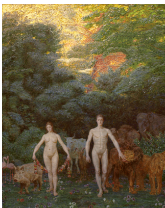
Kristian Zahrtmann, "Adam og Eva i Paradis". 1892, 208x170 cm, Faaborg Museum, kat nr. 345

343 Kristian Zahrtmann, "Adam og Eva i Paradis". 1892, 208x170 cm, Faaborg Museum, kat nr. 345