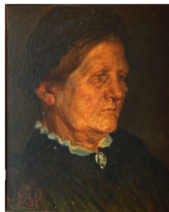
Kristian Zahrtmann, "Kunstnerens moder". 1890- 91, 23x19 cm, Faaborg Museum, kat.nr. 344