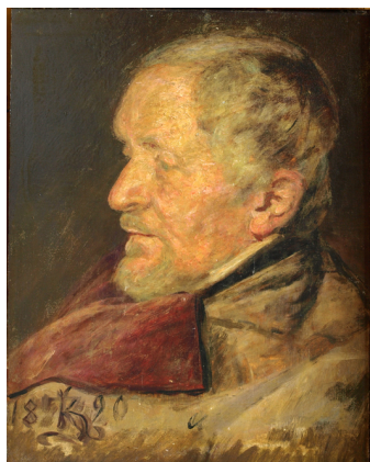
Kristian Zahrtmann, "Kunstnerens fader". 1890, 25x18 cm, Faaborg Museum, kat.nr. 343